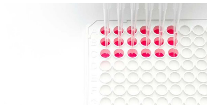
Verteiler für die Kultivierung von Zellen und thermische Ausdehnungseigenschaften